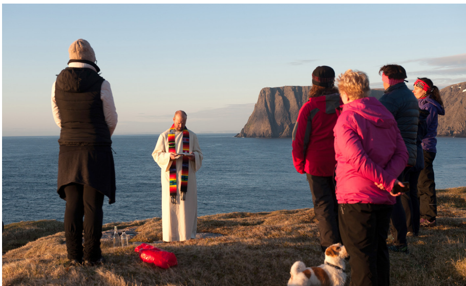
Klimapilegrim 2015 ble innledet ved bønn for skaperverket på Nordkapp i juni.

KNUT REFSDAL, Generalsekretær i Norges Kristne Råd