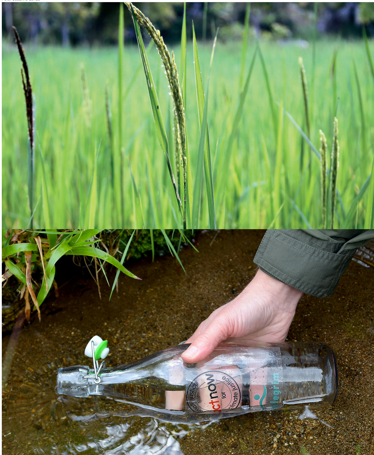
Vann fra hele Norge ble samlet inn i løpet av sommermånedene 2015. Her fra St. Sunnivakilden på øya Selja.