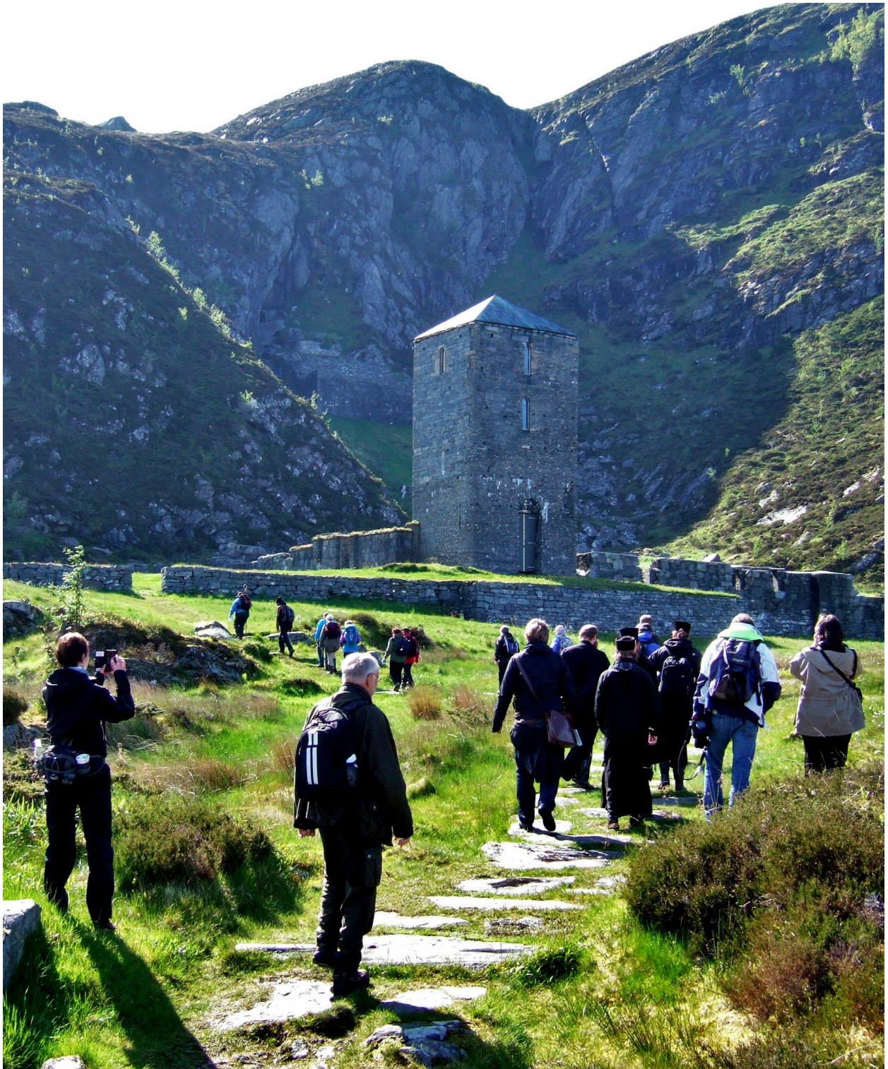
Pilegrimene ankommer klosteret på Selja.